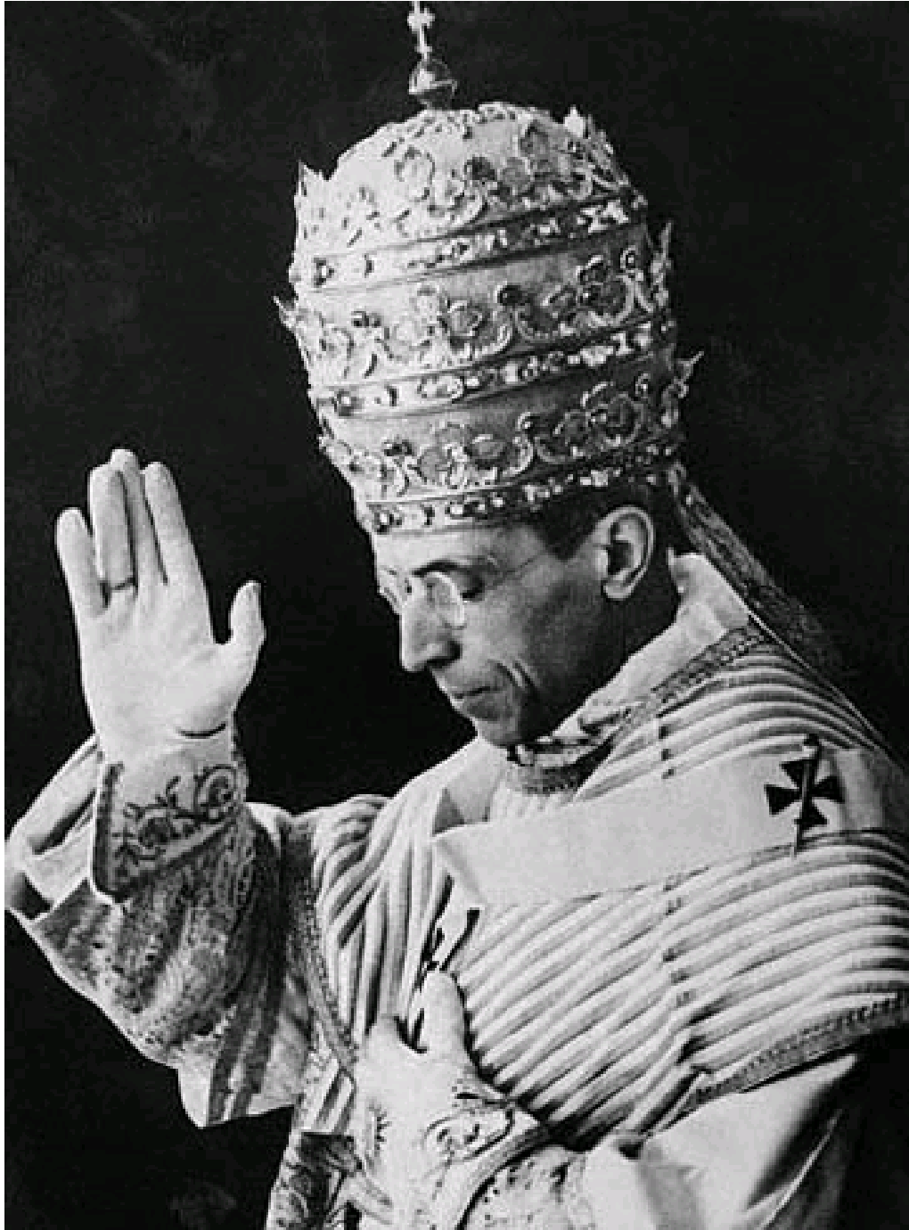
Pius PP XII

Episcopus Romanus, Vicarius Christi, Successor principis apostolorum, Caput universalis ecclesiae, Pontifex Maximus, Patriarcha Occidentis, Primatus Italiae, Archiepiscopus ac metropolitanus provinciae ecclesiasticae Romanae, Princeps sui iuris civitatis Vaticanae, Servus Servorum Dei.